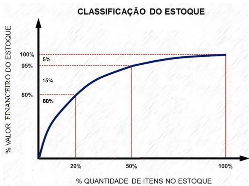
Figura 2: Diagrama de Pareto

57. Observe atentamente a Figura 2 abaixo, contendo um Diagrama de Pareto, conhecido também como “Curva ABC”, instrumento muito usado na Administração de Materiais nas organizações.